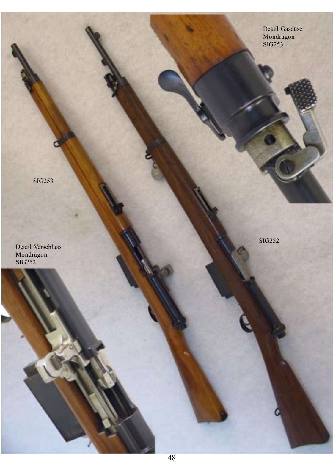
Detail Gasdüse Mondragon SIG253